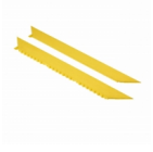
552 MD-X Ramp System™ Nitrile